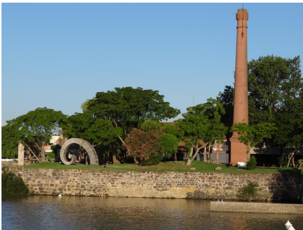
Centro Cultural, Bastión del Carmen, Colonia, Departamento de Colonia.

Colonia del Sacramento, Depto. de Colonia, Uruguay